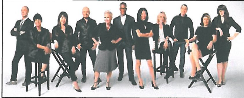
Equipo internacional de Maquilladores Profesionales Mary Kay

Las consultoras de Mary Kay nos acercan sus productos, no son solo vendedoras, si no profesionales de la imagen que nos ayudarán a encontrar los productos específicos para nuestra piel.