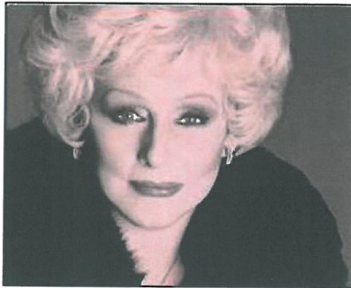
Mary Kay Ash

Mary Kay se funda en 1963 gracias al esfuerzo y la tenacidad de una mujer inspiradora, Mary Kay Ash , que decidió dejar su puesto de directora de ventas para llevar a cabo un sueño, una filosofía de trabajo que incluso se estudia hoy en día en varias universidades.